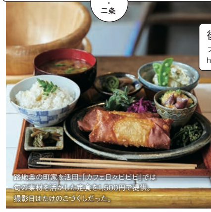
路地奥の町家を活用。「カフェ日タビビ」では旬の素材を活かした定食を1,500円で提供。撮影日はたけのこづくしだった。