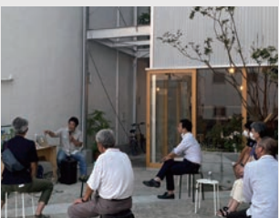
まちづくり意見交換会@東鏡冶屋町窓庫

私たちが、京都地域会もZOOMでの活動が主流となってきましたが、建築と子供たちのワークショップや建築見学会など少しずつ、「正会員が集う」ことを目的としたイベントが開催できたと思います。私が地域会長をさせていただいて2年目の今年は、去年の活動の反省を踏まえて、年間のテーマを掲げて、活動内容を膨らませていきたいと考えています。今年のテーマは、「ちがう景色をつくる」。この2年間で、定着してしまっただけでなく、自分たちの仕