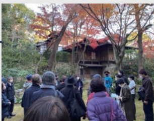
歴史的建築物セミナーの様子

本年度より新たなワークショップ「ミニポートタワーをつくらう」を開催しています。神戸のシンボルであるポートタワーの形の秘密を学ぶプログラムです。手順を理解し丁