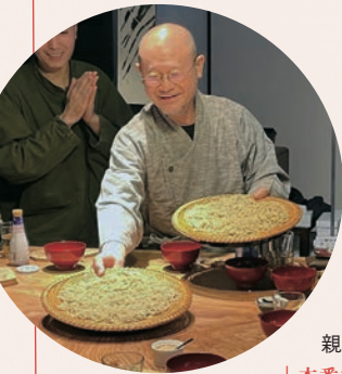
萬野光雄建築設計事務所 https://manno-architect.com