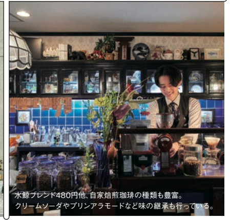
水鯨ブレンド480円他、自家焙煎珈琲の種類も豊富。クリームソーダやプリンアラモードなど味の継承も行っている。