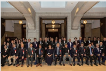
京セラ美術館での総会集合写真