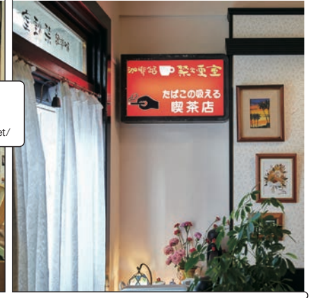
金山大 SWING https://swing-k.net/

水鯨 大阪市西区川口1-4-19 ⑨時〜18時30分（ラストオーダー） 月火曜休 @kissai_suissei