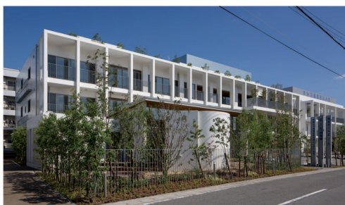
【地域環境の形成を意図した福祉施設】