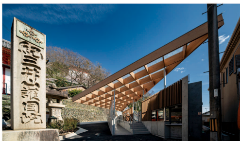
【紀三井寺ケーブル山麓駅】