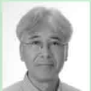
榊瀧川建築デザイン事務所 / 瀧川 嘉彦