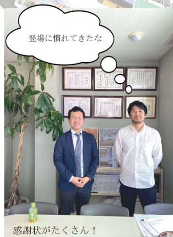
登場に慣れてきたな

協力会員 / (株)LIXIL、YKK AP(株)、(株)ディーケーワークス、大光電機(株)、(株)ダイキアクシス、パナソニック(株)、(株)土橋鍍金工作所、ダイキン工業(株)、三和シャッター工業(株)、(株)富士商会