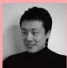
辻岡直樹建築設計事務所(株) / 辻岡 直樹