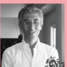
(株)キューブ建築研究所 / 橋本 雅史