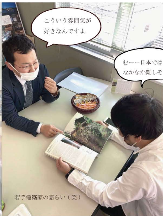
こういう雰囲気が好きなんです