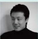
辻岡直樹建築設計事務所(株) / 辻岡 直樹