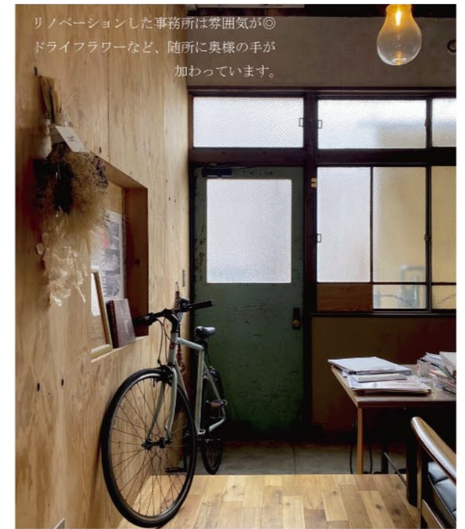
リノベーションした事務所は雰囲気◎ ドライフラワーなど、随所に奥様の手が 加わっています。

A5 基本的にクライアントの意見を尊重。施設等は完全に従いますね。工務店さんからの紹介が多いし、コストの兼ね合いが大きい。住宅はやっぱりうちを選んでくれたと思うので色々提案させていただきます。気に入ってくれたら僕も嬉しい。J. 大きな反発が来たことはない？ あんまりないですね。先に方向性も聞きますし。格好はいいけど、こんな家住めないっていう造りは基本的に好きじゃないので。