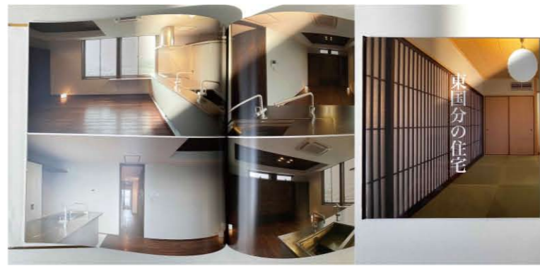
住宅兼事務所の竣工写真。和モダンな雰囲気素敵です。