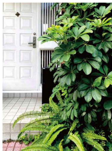
取材・編集 / nha