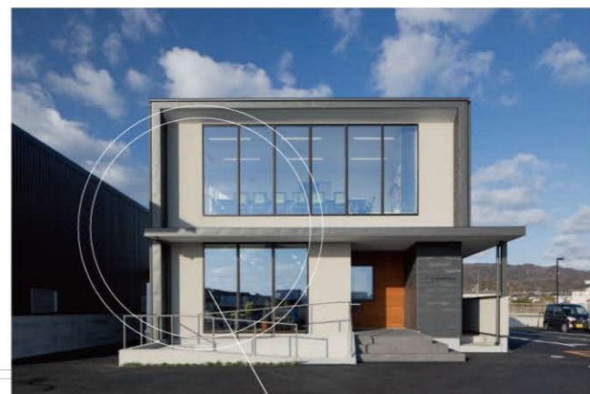
大光電機(株) TOTO(株) 協会員 YKK AP(株)

構造 / 木造2階建 全国を走り回る運転士さん達が帰りたくなる、誇れる場所を作りたいとの経営者からの要望を頂き、スタイリッシュ且つ温かみの感じられる木造2階建ての建物を計画しました。