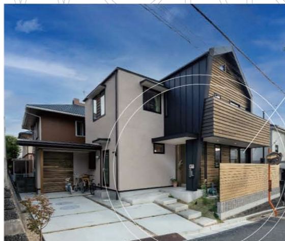
協会員 大光電機(株)、TOTO(株)、YKK AP(株)

構造 / 木造2階建 週末はキャンプや山歩きに出掛けるアウトドア好きのご家族に、より自然と楽しく関わって頂く事を想像しながら計画した住まいです。