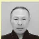
橋本浩行建築設計室 / 橋本 浩行