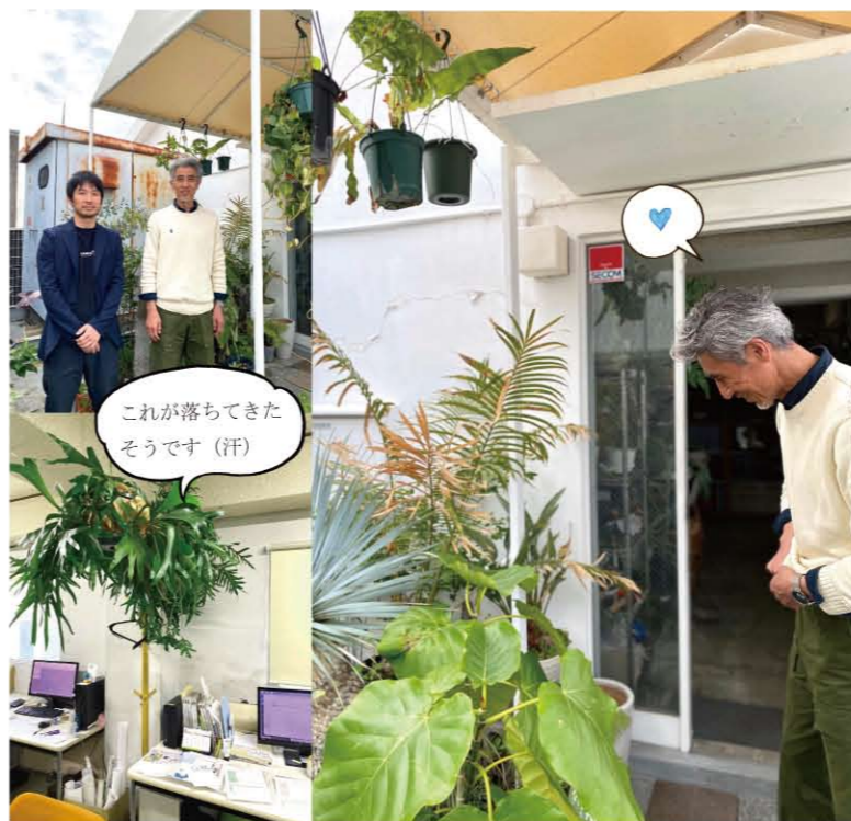
これが落ちてきたそうです(汗)