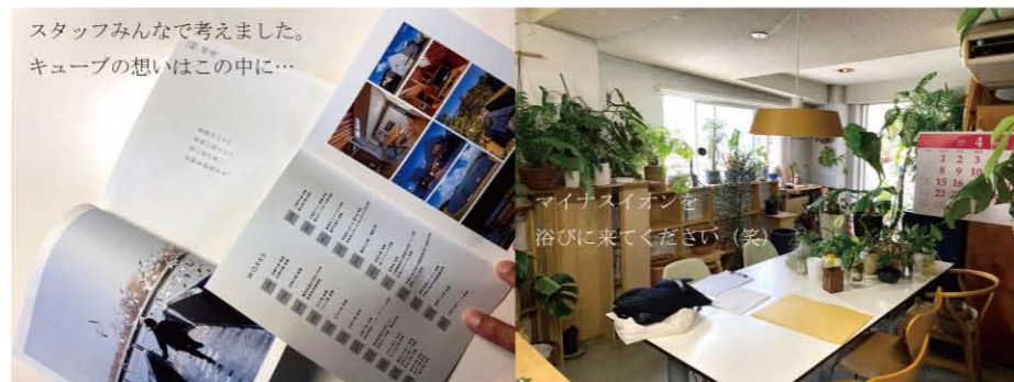
スタッフみんなで考えました。キューブの想いはこの中に…

A.4 聞かれなかった事はある程度こちらで決めさせてもらっていますが、要望された事はお応えします。どうしても格好が悪いと思う時は、AでもないBでもないC案を提示して、C案はA、Bよりも格好良いという事をわかっていただく。費用を出されるお客様のお気持ちを尊重します。