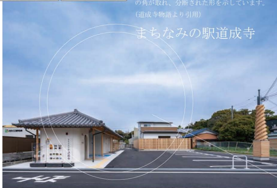
まちなみの駅道成寺