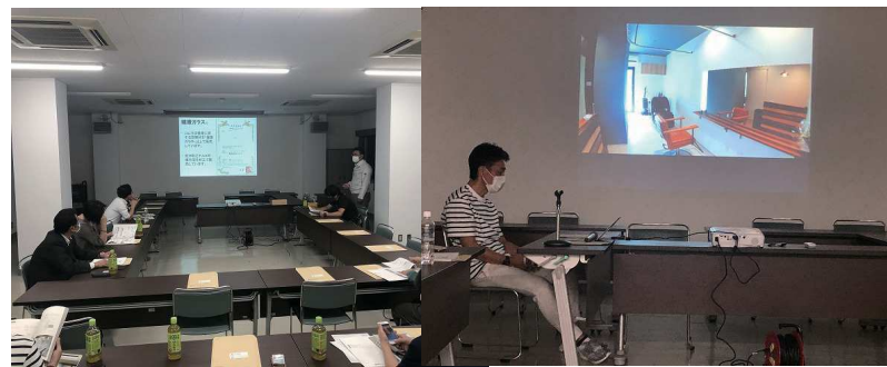
※9・10月度勉強会は新型コロナウイルス対策として、参加者は協会員・正・準・スタッフ会員に限定。広めの会場でマスク着用、換気をしながらの開催となりました。