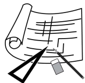
不二設計 生駒 義範

地上高さ約3mの岩の上に小さなお社がある。 立派なお社ではなく岩の上にひっそりと樹木に寄り添うように建っている。 CB造で床面積は1畳弱の規模、棟までの高さは約1.7m、地上からの高さは4.7mにもなる。 和歌山市は群発地震の多い地域であるが崩れ落ちることもなく悠然と建っている姿は何となく不安定ではあるが頼もしさも感じられる。 一説にはこのお社は難除けの神様が祀られているそうだ。 階段の手前には清め塩、お社にはお供え物が置かれている。 この地域は第4種風致地区内である為、開発によりお社の周りは削り取られてしまっている。 長い年月で壊れることもなく、お参りする人の信心の強さかまたは神憑りの建物と言える。 小さな建築の文化である。